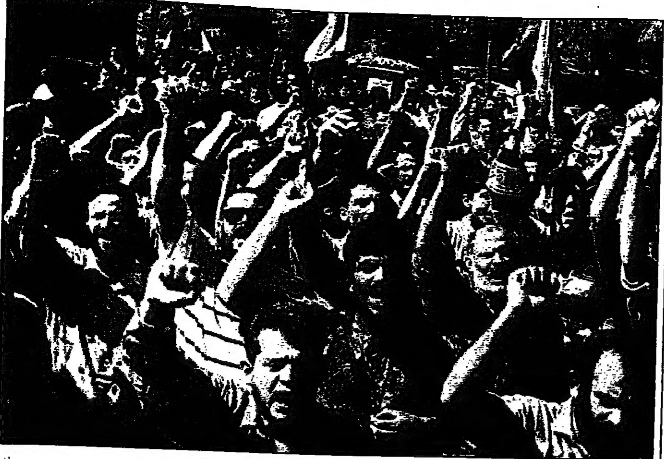
انصار حزب الله يتظاهرون ضد امريكا لتأييدهم احد مقاتلي الحزب في بعلبك (سبتمبر)

وقال ان موقفه من مؤتمر الدوحة الاقتصادي الذي سيعقد في تشرين الثاني (نوفمبر) المقبل وشاركه فيه اسرائيل مرتبط بجوهره لبنان الذي يشاركه في الصراع العربي الاسرائيلي، لبنان يعتبر ان هذا المؤتمر لا يخدم الاهداف الوطنية والقومية من افضل اعادة النظر فيه في ضوء تشرط المفاوضات العربية الاسرائيلية واصرار اسرائيل على املاء نظرتها على الجميع.